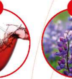
P LUPINEN UND DARAUS GEWONNENE ERZEUGNISSE

z.B. Fruchtsäfte, Mischfruchtsäfte, Brot, Fleischergewürze, Feinkostsalate, Suppen, Soßen, Sauerkraut, Fruchtsäfte, Dressings, Saucen, getrocknete, getrocknete, getrocknete, getrocknete