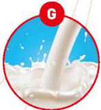
G MILCH VON SÄUGETIEREN UND MILCHERZEUGNISSE (INKLUSIVE LAKTOSE)

z.B. Brot, Kuchen, Gebäck, Feinkostsalate, Margarine, Schokolade, Bräunung, die Mehl, Schokolade, Kakaosauce, Soßen, Dressings, Mayonaisse, Mayonaisse, Eis, Sportnahrung, Diätetische, Kaffeeersatz