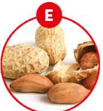
E ERDNÜSSE UND DARAUS GEWONNENE ERZEUGNISSE

z.B. Fischfilet, Salate, Suppen, Wurstwaren, Würste, Surimi, Sardellenkonserven, Brotkrumen, Feinkostsalate, Pasteten, Vollkornbrot