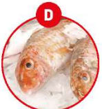
D FISCH UND DARAUS GEWONNENE ERZEUGNISSE (AUSSER FISCHGELATINE)

z.B. Eiergebäck, panierte Speisen, Mayonaisse, Palatschinken, Kuchen, Gebäck, Brot, Nudeln, Croissants, Fischcheiter Braten, Burger, Feinkostsalate, Pfannkuchen, Omelette, Soßen, Dressings, Desserts