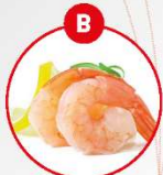
B KREBSTIERE UND DARAUS GEWONNENE ERZEUGNISSE

z.B. Brot und Gebäck, Nudeln, Tortwaren, Suppen, Soßen, Paniermehl, Samenmehle, Wurstwaren, Backwaren, Frischbrotkrumen, Desserts, Schokolade