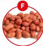
F SOJAHÖHNEN UND DARAUS GEWONNENE ERZEUGNISSE

z.B. Margarine, Brot, Nudeln, Gebäck, Schokolade, Dressings, Saucen, Cerealien, Mehl, Erdnussöl, Erdnuss, Schokolade, Feinkostsalate, Mayonaisse, Sekt, Eis, aromatisierter Kaffee, Likör, (Präparat) Eis