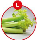
L SELLERIE UND DARAUS GEWONNENE ERZEUGNISSE

z.B. Brot, Kuchen, Gebäck, Bräunung, Pannkuchen, Roh-Drahtwaren, Feinkostsalate, Pasta, Feinkostsalate (Erdnuss), Joghurt, Käse, Nüsse, Nussbrot, Sardellen, Mehl, Schokolade, Margarine, Mülligehal, Kakaosauce, Dressings, Curry, Pasta, Eis, Saucen, Likör, aromatisierter Kaffee