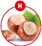
H SCHALENFRÜCHTE UND DARAUS GEWONNENE ERZEUGNISSE

z.B. Brot, Kuchen, Gebäck, Brötchen, Kaffee, Roh-Drahtwaren, Feinkostsalate, Margarine, Nussbrot, Nussbrot, Schokolade, Karamell, Aufläufe, Spinat, panierte Speisen, Bräunung, Pannkuchen, Frische, Chips, Suppen, Soßen, Dressings, Mayonaisse, Desserts, Kakaosauce, Likör, aromatisierter Kaffee