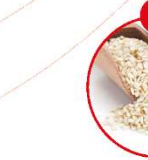
N SESAMSAATEN UND DARAUS GEWONNENE ERZEUGNISSE

z.B. Fleischergewürze, Feinkostsalate, Suppen, Soßen, Dressings, Mayonaisse, Kaffee, entzuckerter Kaffee, Gewürzbrühen, Kakaosauce, Essig, Curry, saure, Saucen, Saucen