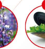
R WEICHTIERE WIE SCHNECKEN, MUSCHLEN, TINTENTIERE UND DARAUS GEWONNENE ERZEUGNISSE

z.B. Brot, Gebäck, Pizza, Fleischergewürze, Fleischersatz/ vegetarische Produkte, glutenfreie Produkte, Desserts, milderer Essigsatz, Kaffeeersatz, Nussgewürze