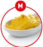
M SENF UND DARAUS GEWONNENE ERZEUGNISSE

z.B. Suppen, Gewürze, Kartoffel, Fisch, Fisch, Fisch, Fisch, Fisch, Fisch, Fisch, Brot, Suppen, Eingelegte, Curry, saure, Saucen, Saucen