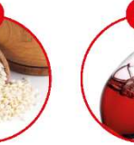
O SCHWefeldioxid UND SULFITE

z.B. Brot, Kuchen, Gebäck, Bräunung, Pannkuchen, Roh-Drahtwaren, Feinkostsalate, Pasta, Feinkostsalate (Erdnuss), Joghurt, Käse, Nüsse, Nussbrot, Sardellen, Mehl, Schokolade, Margarine, Mülligehal, Kakaosauce, Dressings, Curry, Pasta, Eis, Saucen, Likör, aromatisierter Kaffee