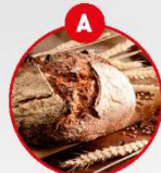
A GLUTENHALTIGES GETREIDE UND DARAUS GEWONNENE ERZEUGNISSE

z.B. Brot und Gebäck, Nudeln, Tortwaren, Suppen, Soßen, Paniermehl, Samenmehle, Wurstwaren, Backwaren, Frischbrotkrumen, Desserts, Schokolade